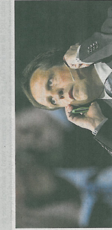
Pechtold 'krijgt een belletje' van premier Rutte.

Waarna Clinton onder luid applaus het podium verlaat. Een kwartierje later verlaat de zwarte kolonne het dorp en haast iedereen zich naar de warme maaltijd.