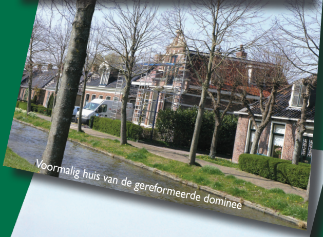
Voormalig huis van de gereformeerde dominee