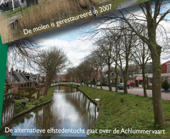
De alternatieve elfstedentocht gaat over de Achlummervaart