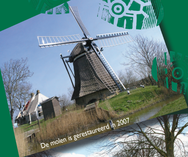
De molen is gerestaureerd in 2007

Een paar kilometer wandelroutes in en om Achlum.