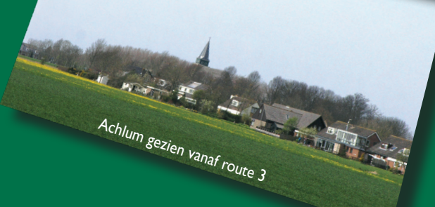
Achlum gezien vanaf route 3